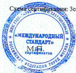
Схема сертификации: Зс.